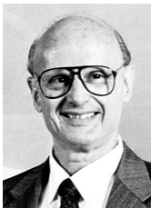
Harry M. Markowitz

Nel 1990 il premio in memoria di A. Nobel viene conferito congiuntamente a: